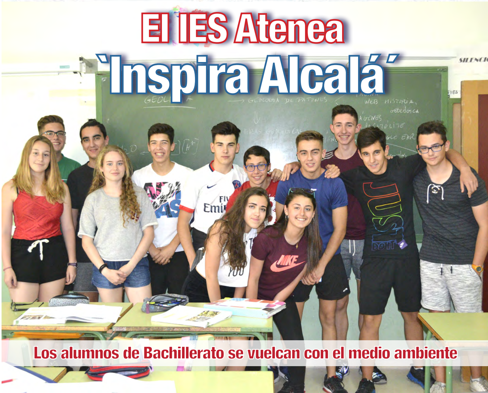
Los alumnos de Bachillerato se vuelcan con el medio ambiente